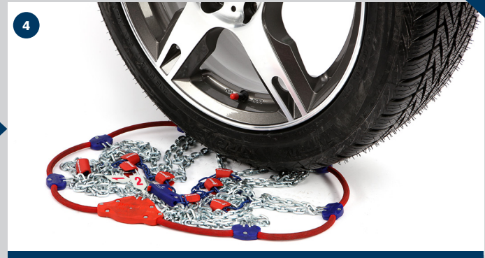
Demounting pewag snox