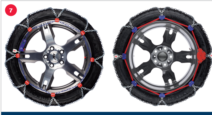
Mounting pewag snox