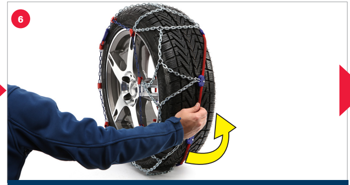
Mounting pewag snox